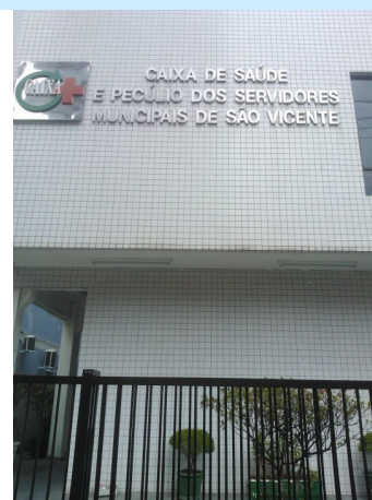
Ambulatório da Caixa de Saude. De São Vicente.. Frei Gaspar 157

Então não marque sem autorização prévia, evitando transtornos e aborrecimentos. Casos raros e